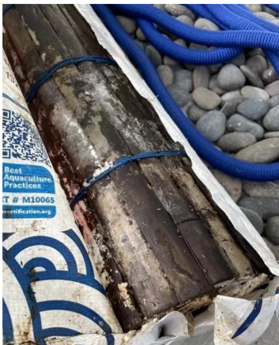
ภาพที่ 1 ภาพเชื้อราที่เกาะบนผิวของเผือกไม้ไผ่

โดยในปีที่ 2 นี้ ชุมชนต้องการนำเสนอความสวยงามทางธรรมชาติในรูปแบบการจัดการท่องเที่ยวของชุมชน ชุมชนจึงต้องการเผยแพร่วิถีชีวิตความเป็นอยู่สู่ธรรมชาติแก่สาธารณชนทุกรูปแบบ อาทิ การได้ชม-สัมผัส วิถีชีวิตที่เรียบง่ายอย่างใกล้ชิดที่รายล้อมด้วย