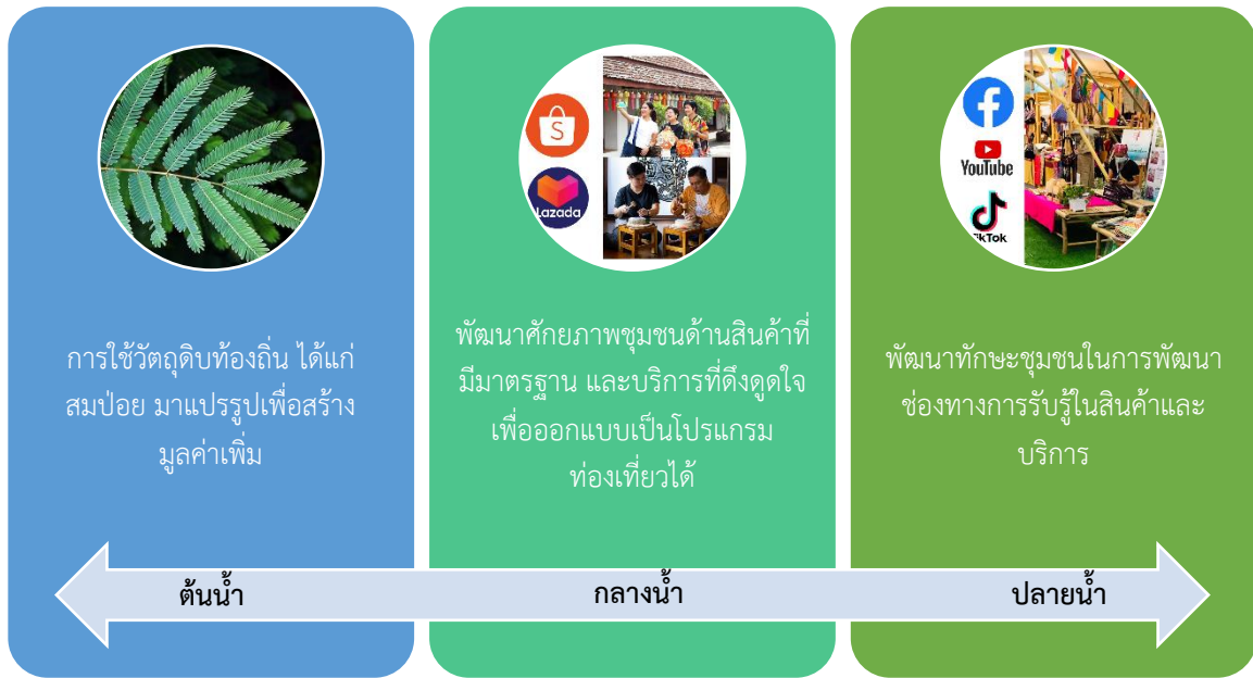
แผนภาพ 1 ห่วงโซ่คุณค่าบ้านแม่ตะมาน